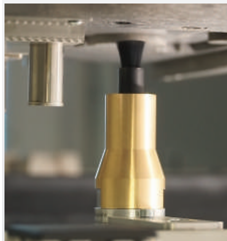
Automatisches Bürst-System integriert im Prozessraum

Weitere Optionen auf Anfrage. ● Standard ○ Option